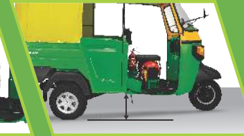
ऊंचा ग्राउंड क्लियरेंस

अंकित चित्र एवं तकनीकी मापदंड, ऐसे एक्सेसरीज और वैकल्पिक उपकरण के प्रकारों को दिखा सकते हैं जो मानक विशिष्टताओं का हिस्सा नहीं हैं। पियाजियो आपके पास पूर्व सूचना दिए बिना तकनीकी विनिर्धारणों और फीचर्स को बदलने का अधिकार सुरक्षित है।