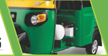
40 लीटर CNG सिलिंडर